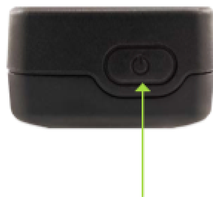
Botón de encendido/apagado

* Manteniendo pulsado el botón SOS durante 5 segundos provoca el envío de la señal de emergencia al organizador